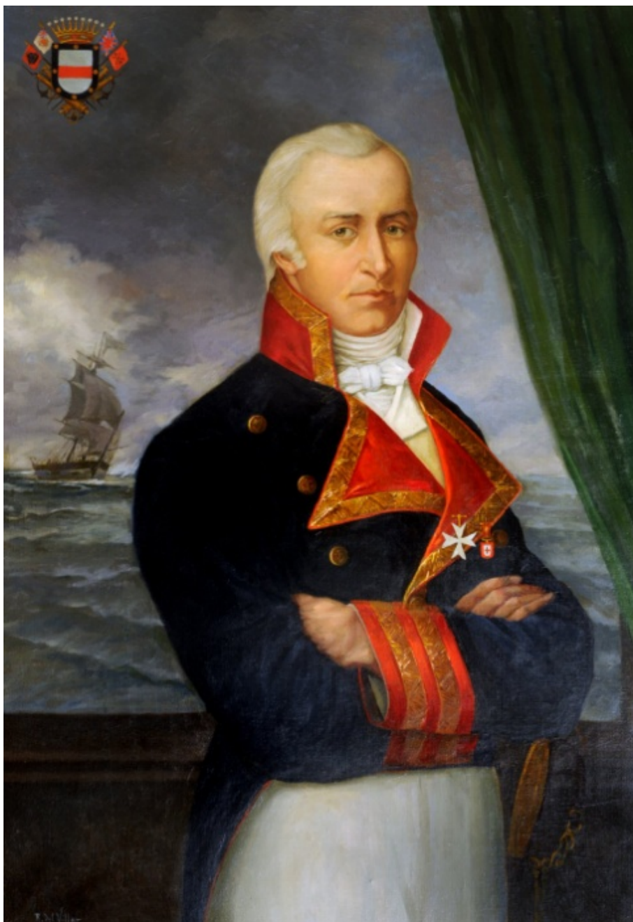
Santiago de Liniers