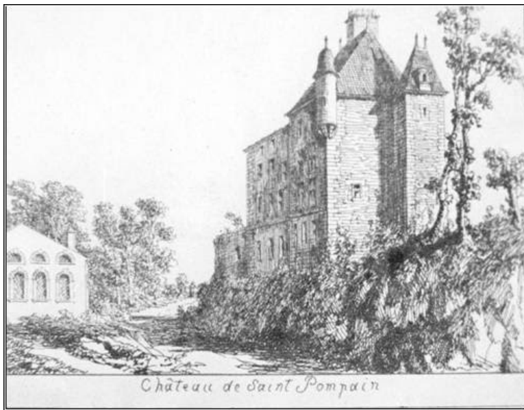
Castillo de Saint-Pompain 7

Podríamos ascender por el frondoso árbol genealógico de Santiago de Liniers, por línea paterna y materna directa, hasta el siglo XIII y verlo entroncar con las más antiguas familias nobles y caballerescas de Francia así como con los reyes de la Cristiandad, como San Luis IX, rey de Francia (1214-1270).