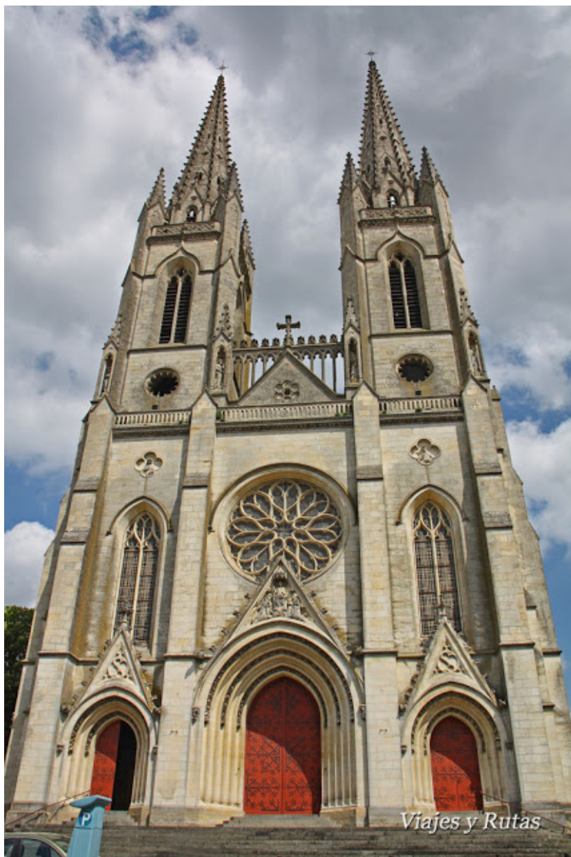
Catedral de Niort (Deux-Sevres) 63