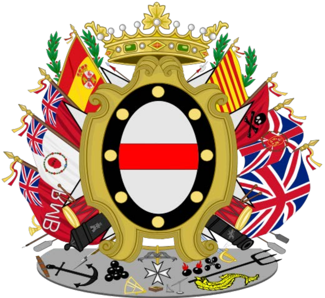
Armas de Santiago de Liniers

Dirá también nuestro personaje: “Yo recorrí la línea diciendo a mis soldados que la contraseña era Santiago y la Victoria que era nuestra; todos me respondieron con gritos de viva el rey y que tenía razón” 30 .