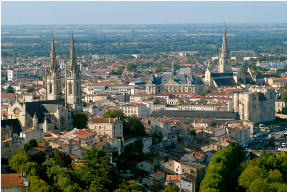
Vista de Niort, cabecera del departamento de Deux-Sevres 65