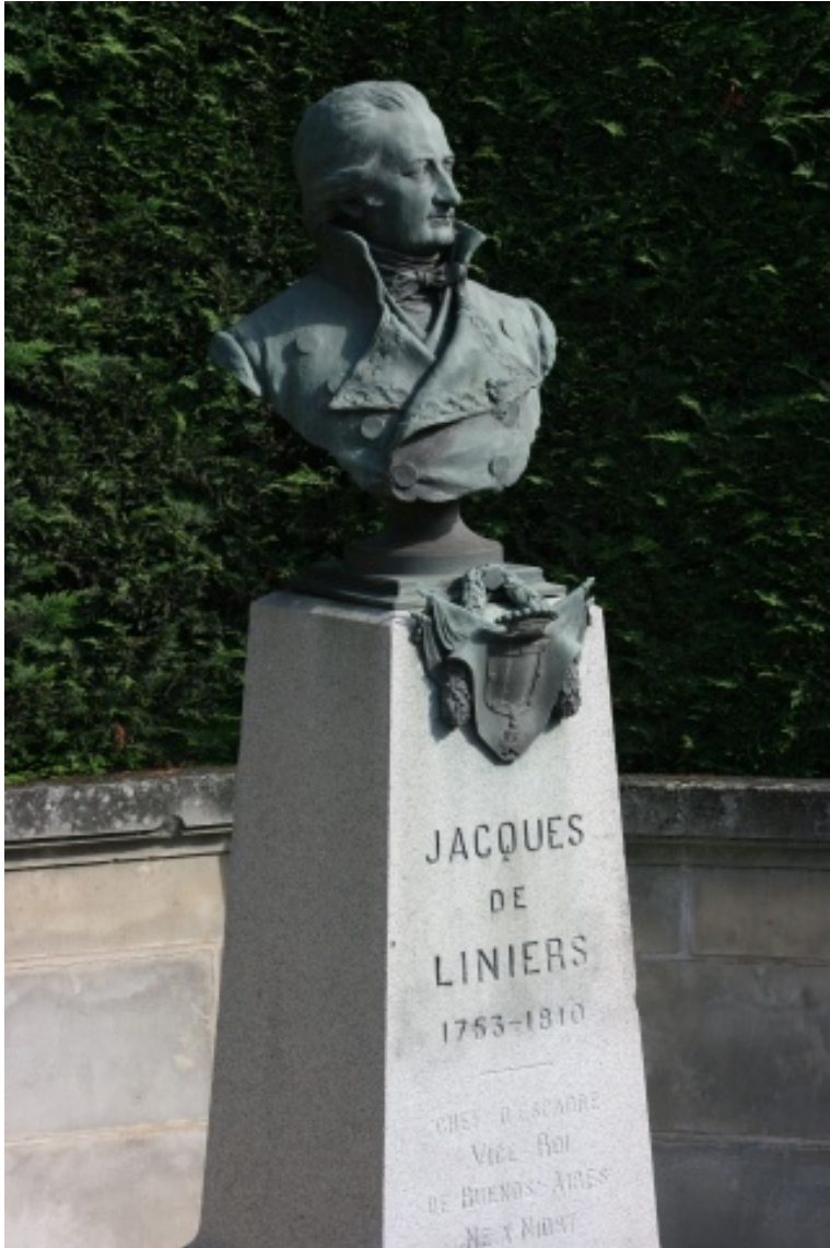
Monumento a Santiago de Liniers en su tierra natal Ne y Niorst (Deux-Sevres)