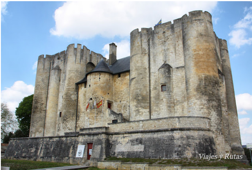
Niort (Deux-Sevres) Donjon –vista del frente- 62