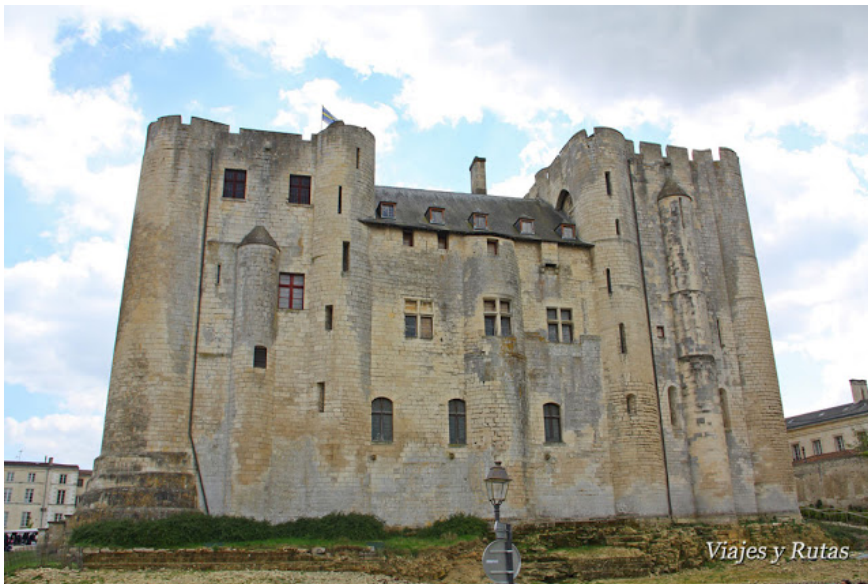
Niort (Deux-Sevres) Donjon –vista posterior- 63