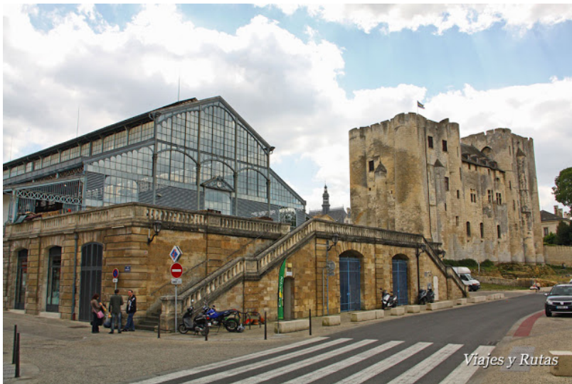
Mercado de Niort (Deux-Sevres) 66