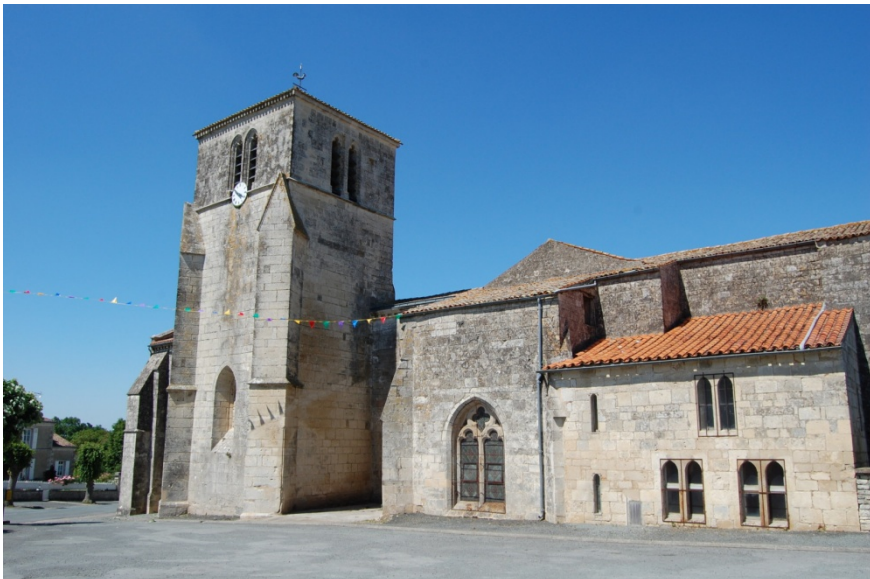
L'église de Saint-Pompain (Deux-Sevres) 60