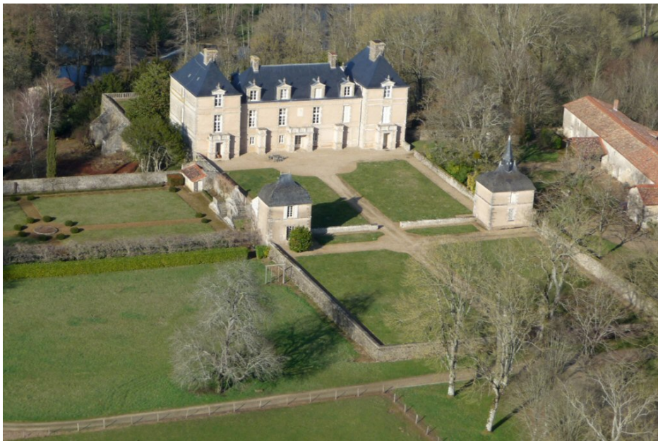
Château des Moulières, Saint-Pompain (Deux-Sevres) 61