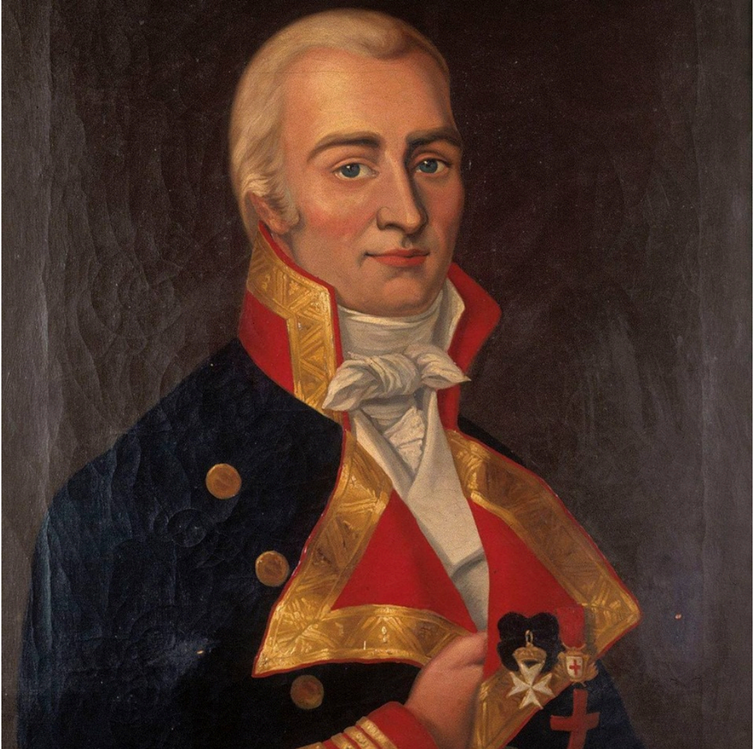
Santiago de Liniers 42