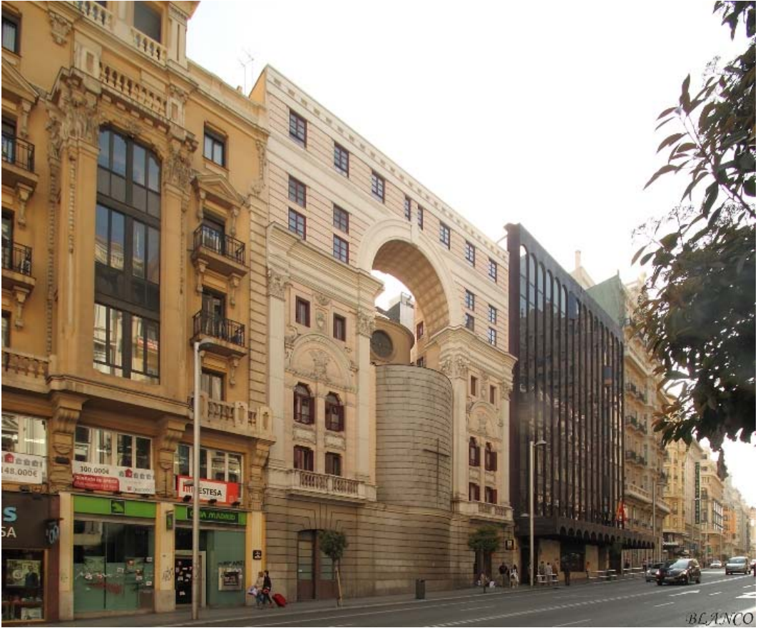
Oratorio del Santísimo Sacramento , sobre la Gran Vía de Madrid entre las calles de la Hortaleza y del Clavel