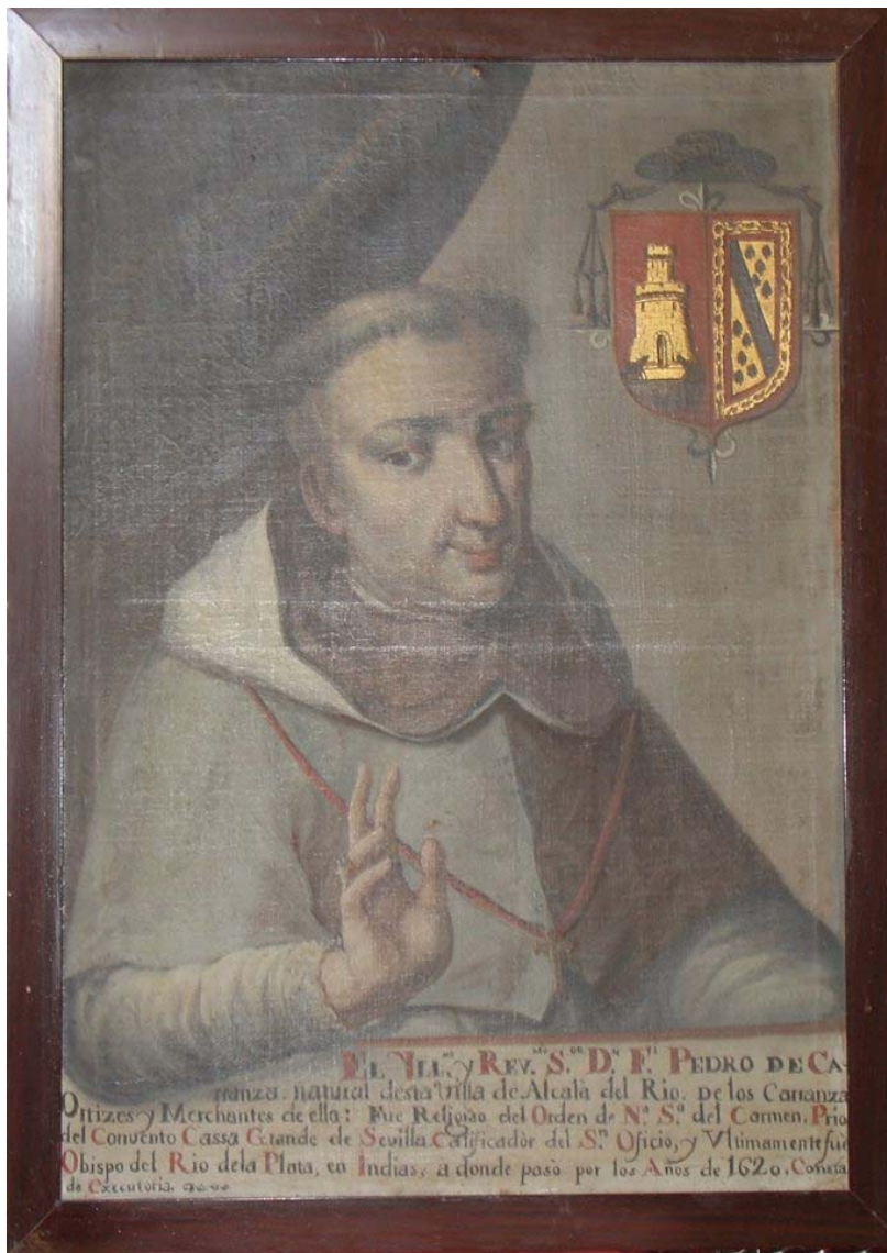
Fray Pedro de Carranza, O.C., Primer Obispo de Buenos Aires 1621-1632

ordenada en la Ley 22, tít 1, Lib. I de la Recopilación de Leyes de Indias, en acción de gracias por haber llegado a salvo los galeones de la flota de 1625.