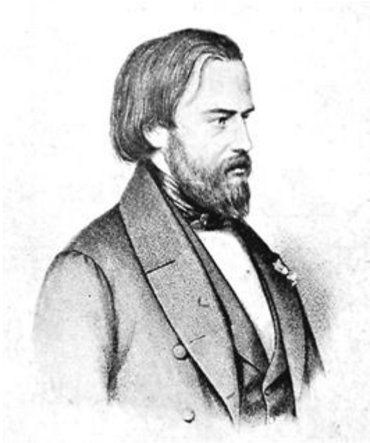
Federico de Ozanam 3

ayuda espiritual y material a las familias y personas más necesitadas 2 .