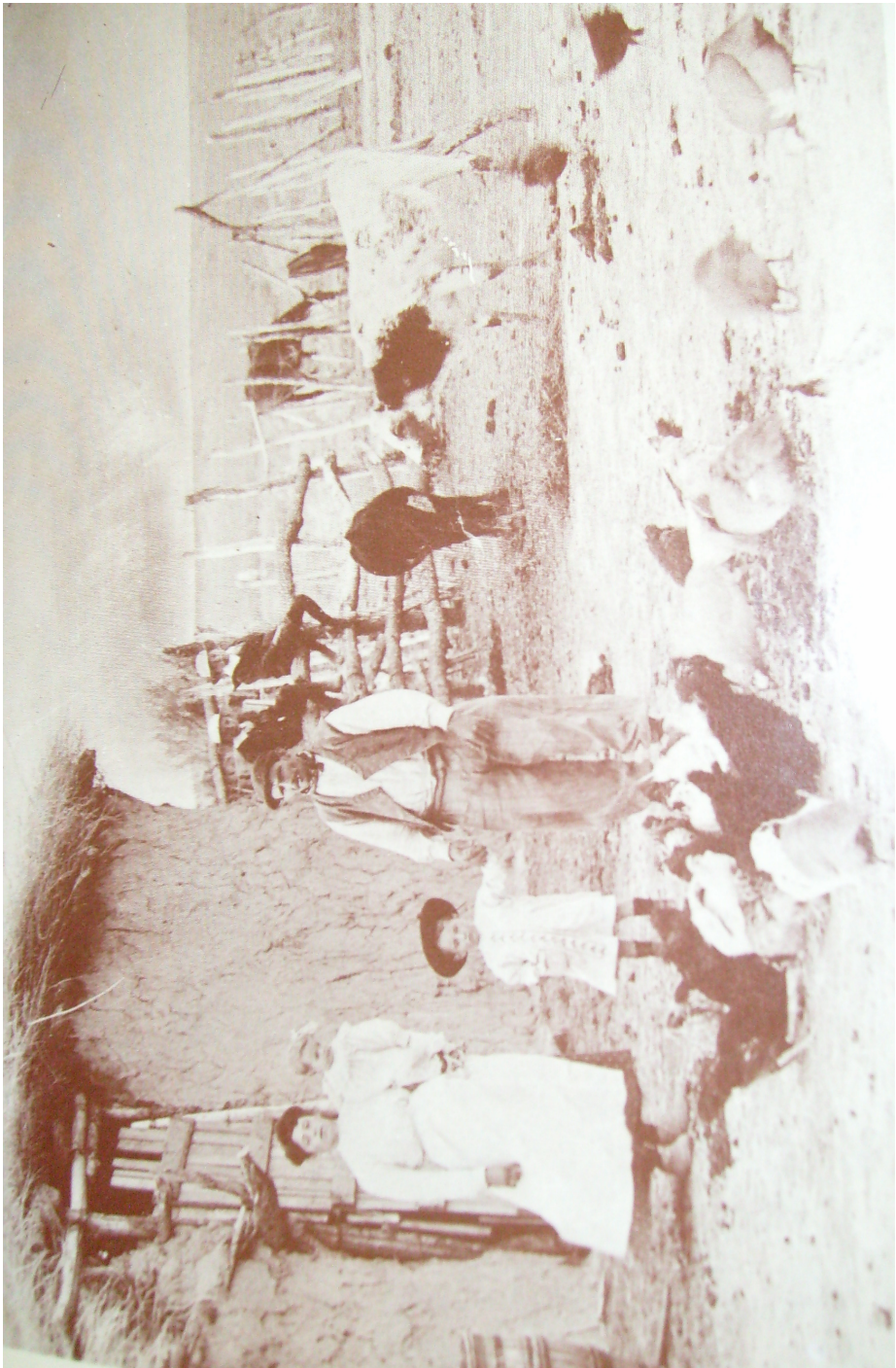
En la chacra con aves y vacunos.