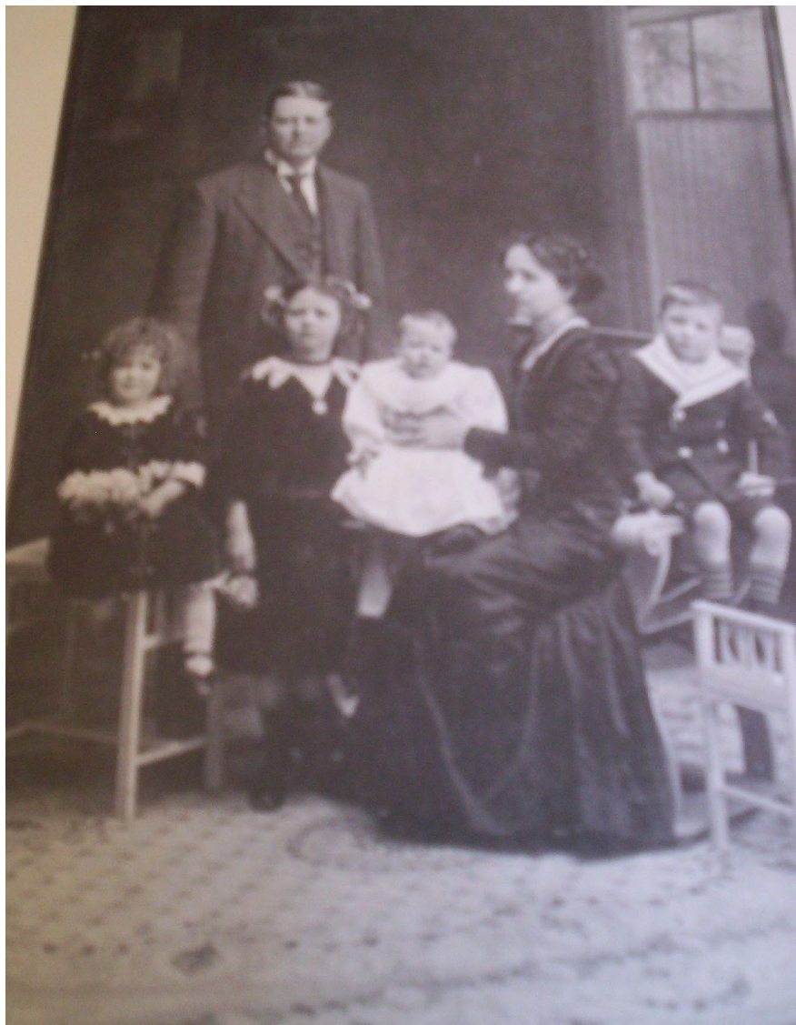
Retrato realizado por el estudio Bixio y Cía. 18