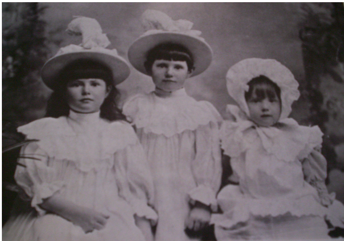
Las hijas de Edward Williams fotografiadas por Chute & Brook, c. 1910 19 nos muestran a la segunda generación en todo su esplendor.

Como en la Colonia no se había generalizado el uso de retratos infantiles individuales, tal vez por razones económicas, los niños aparecen casi siempre formando parte de grupos familiares.