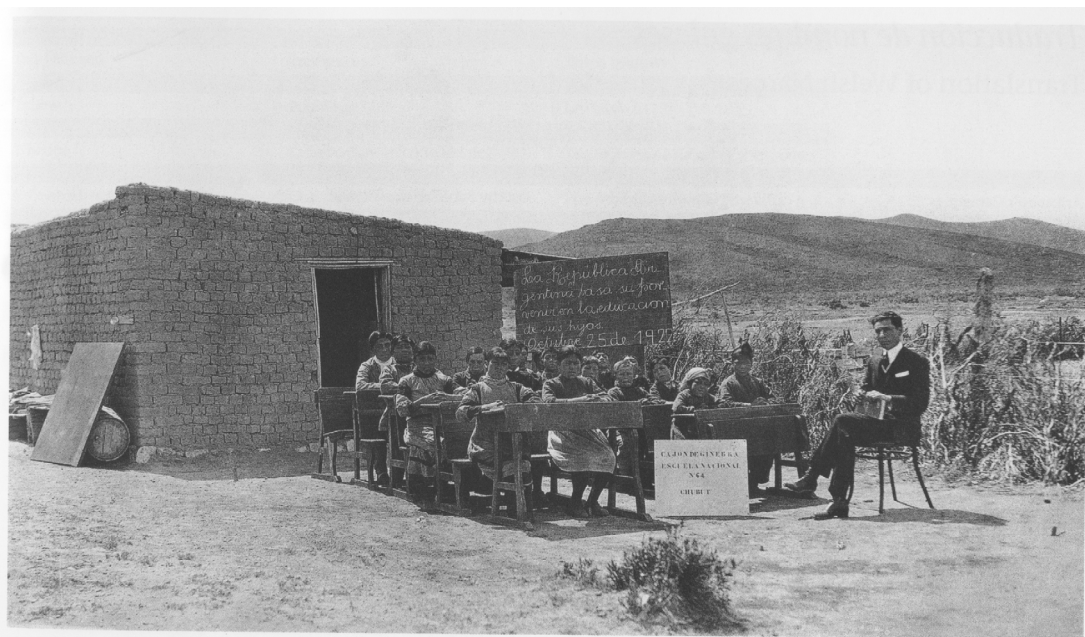
Escuela Cajón de Ginebra-Centro de Estudios Históricos de Puerto Madryn

En 1904 se creó la Camwy Intermediate Education Society con el objetivo de establecer una escuela secundaria que se inauguró en 1907. En ella los jóvenes tuvieron la oportunidad de realizar su secundario en galés.