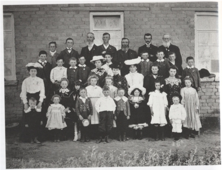
Capilla Seión de Bryn Gwyn, del grupo metodista-calvinista – 1907 12

Las fotografías de los niños de las capillas son todas exteriores, ya que por ser un recinto sagrado no era lugar apto para tomar fotografías.