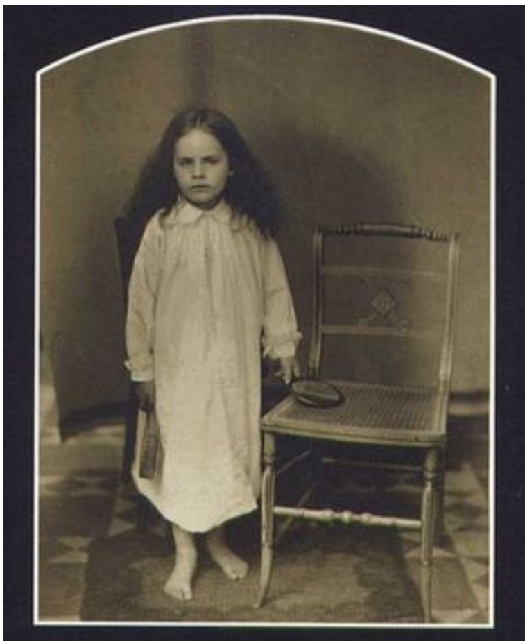
Charles Dodgson (Lewis Carroll)

¿Cómo se representaba a los niños en los estudios fotográficos de Gales y su vecina Inglaterra cuando partieron los inmigrantes? Predominaba la estética de los fotógrafos victorianos, entre ellos Charles Dodgson o, más conocido por su seudónimo, Lewis Carroll. El autor de Alicia en el país de las maravillas dejó que los niños fotografiados construyeran el tema de la foto a través de sus propios juegos y disfraces.