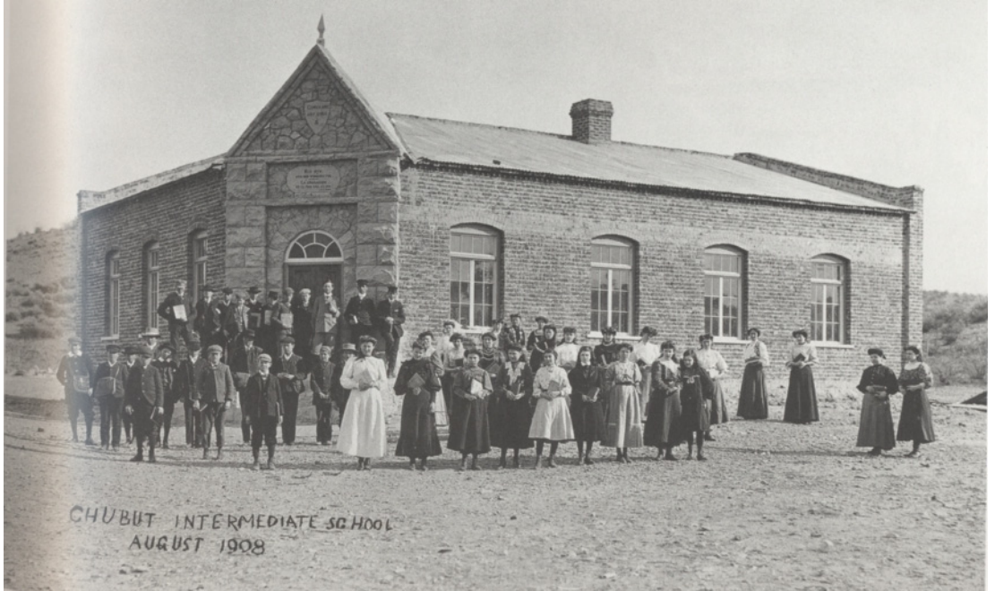
Camwy –Escuela secundaria de Gaiman- 1908 11

el valle inferior del río Chubut donde se asienta la Colonia Y Wladfa.