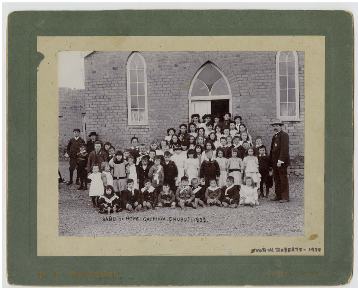
La Band of Hope de la Capilla de Gaiman. Bowman, 1908.

Reconocemos la vieja capilla Bethel que se encuentra al lado de la nueva Bethel construida posteriormente. Acompañados por su maestro de canto, que al igual que los pastores ostentaban un rango superior en la casi igualitaria sociedad galesa patagónica.