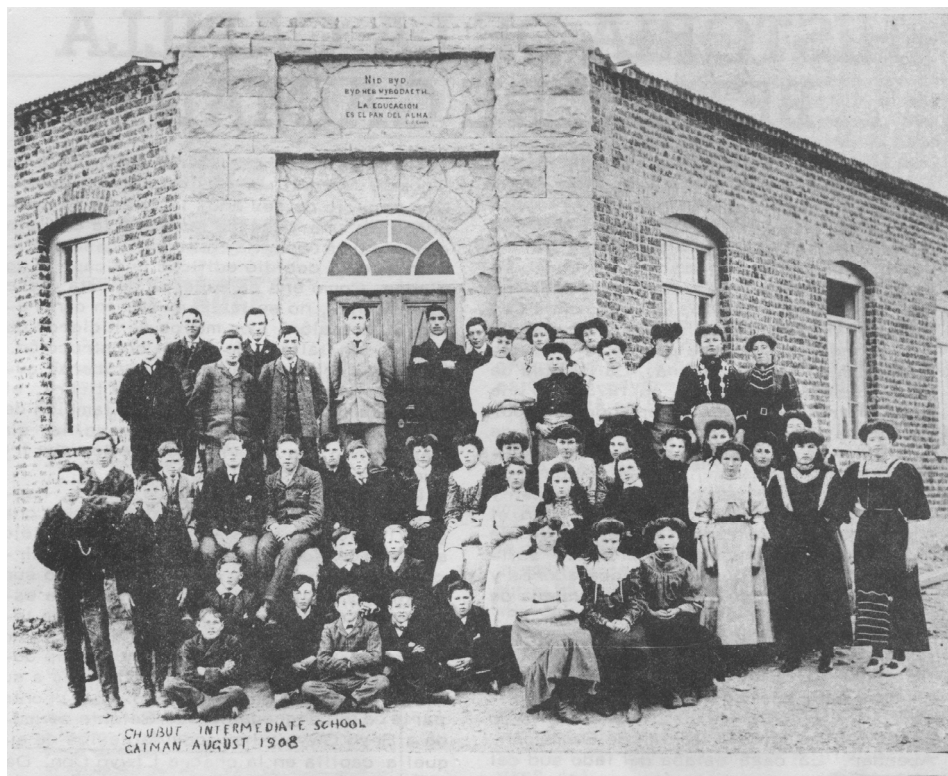
Camwy –Escuela secundaria de Gaiman- 1908

ir a la capilla, se encuentran agrupados por sexo y muy separados entre sí. Parece la “foto oficial” de la escuela.