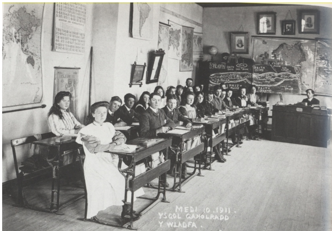
Camwy - Escuela secundaria de Gaiman

Otro interior corresponde a la escuela estatal de Gaiman. La bandera nacional, el mapa de la República Argentina y las láminas con temas de nuestra historia muestran nuevamente la tutela del Estado en esta población típicamente galesa.