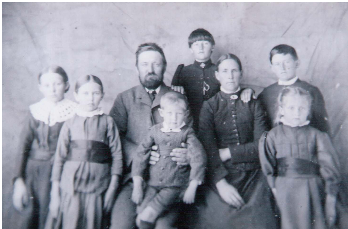
Grupo familiar fotografiado por John Murray Thomas

Por último presentamos dos fotos con una profunda carga simbólica: