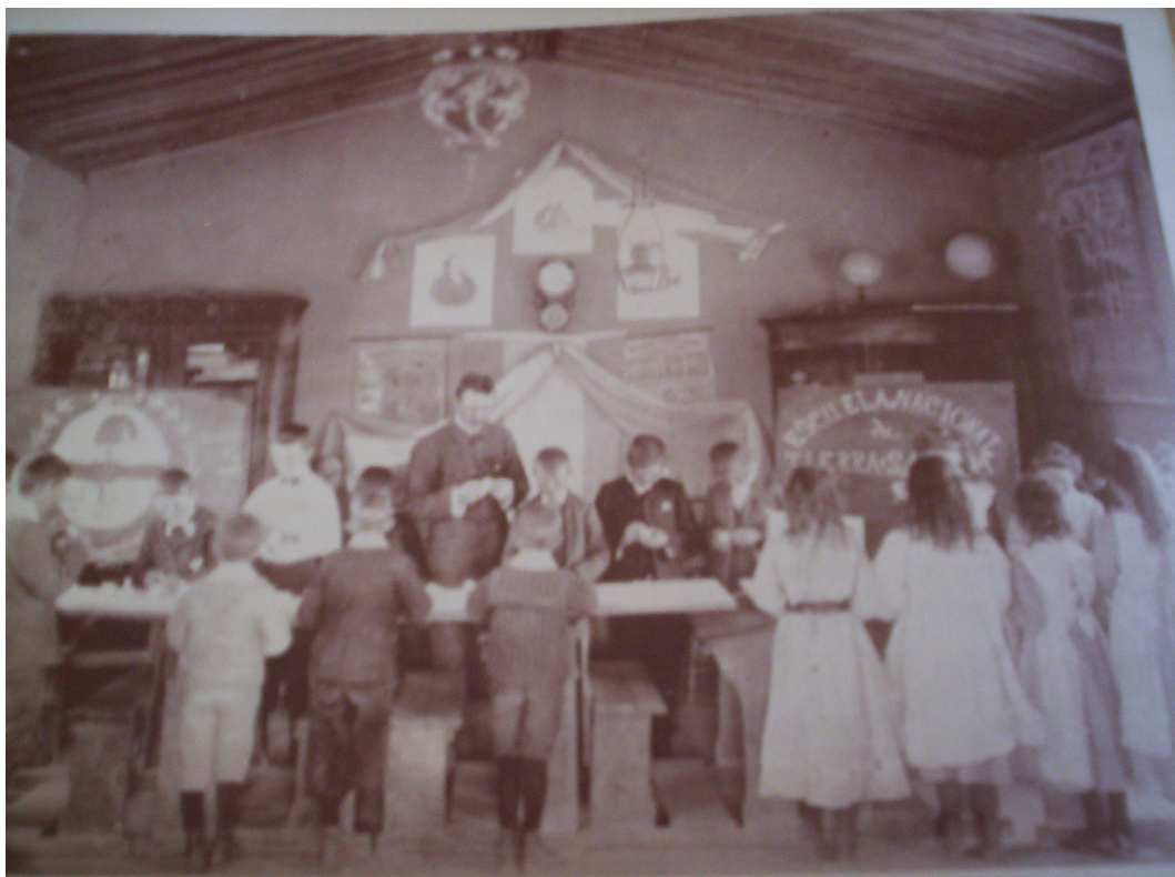
Escuela Nacional de Tierra Salada

Se puede apreciar el uso del escudo oficial que indicaba que era una escuela del Estado, a diferencia de las escuelas galesas que no lo usaban.