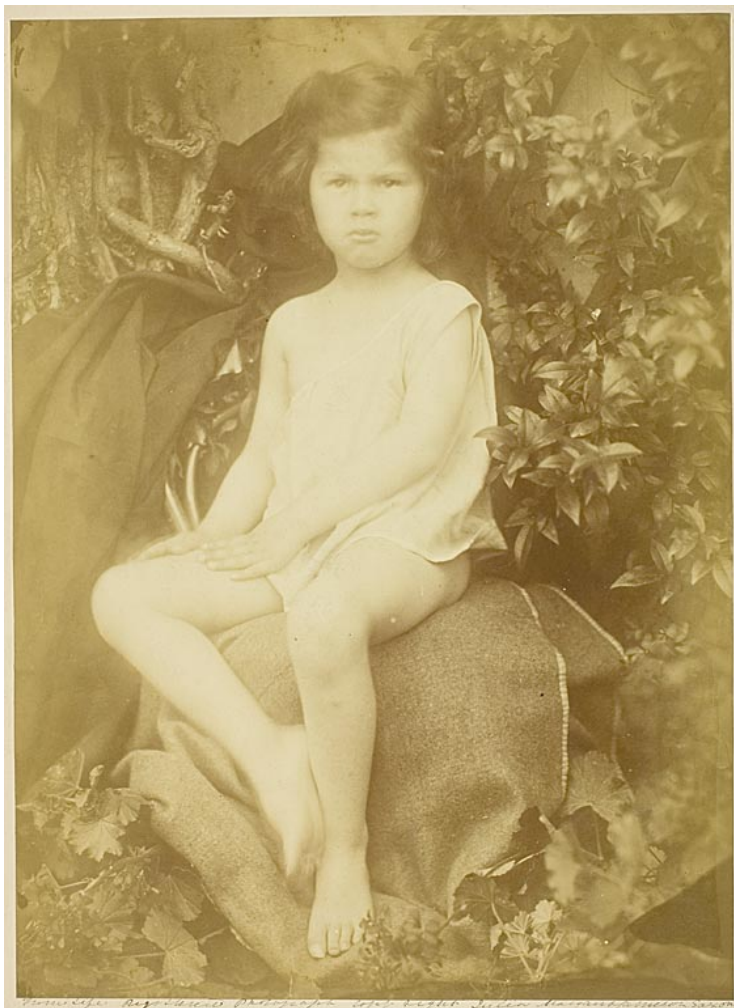
Julia Margaret Cameron. Estudio para el Infante Saint John, 1872.

Otra fotógrafa, Julia Margaret Cameron, retrataba niños en composiciones alegóricas, previamente armadas. Ambos artistas eran deudores de la estética pictorialista que buscaba en la fotografía los refinamientos propios de la pintura y se basaba en fuentes literarias.