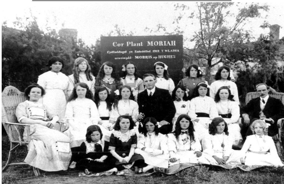
Capilla Moriah (Trelew –Eisteddfod, celebrado en 1912.

Encuentro entre los miembros de las capillas de Trevelin y Esquel. “Estudiaban la Biblia, no es cierto, y una vez por año se juntaban las dos capillas y entonces se hacía como un examen, le tomaban escrito y oral a los chicos que iban a la capilla” 13 . “...y después se reunían, había otra reunión de canto, que se aprenden muchos himnos y después un domingo se va y se junta toda la gente y se canta (...) Había unos cantores, unas voces hermosas.” 14