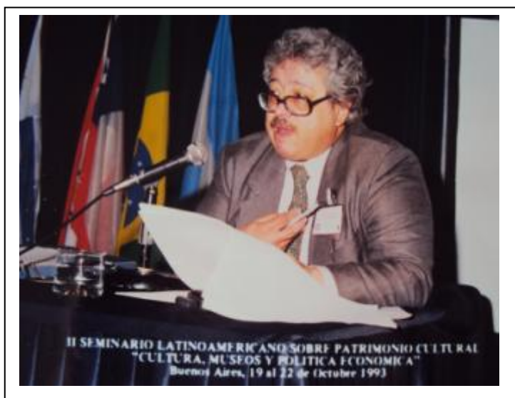
Ulpiano Bezerra Meneses

En la década siguiente los desafíos que los museos debían afrontar estaban vinculado a las nuevas características del público visitante y cómo captar su atención; al uso de las nuevas tecnologías y también a las diversas formas de obtención de recursos económicos. Frente a estos nuevos escenarios ICOM Argentina, bajo la presidencia de la Lic. Mónica Garrido, decidió fortalecer la formación y actualización profesional de museólogos y especialistas de las más diversas disciplinas que trabajaran en museos y en instituciones culturales y educativas a través de los Seminarios Latinoamericanos sobre Patrimonio Cultural. Desarrollados entre 1992 y 2000, sus temáticas fueron “Política económica aplicada a las instituciones culturales” en 1993, “Multimedia e Internet”, en 1994, “Museos y Turismo sustentable”, en 1995, etc. 19